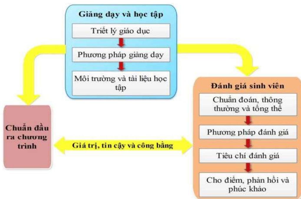
Hình 2. Quy trình giảng dạy học tập và đánh giá sinh viên